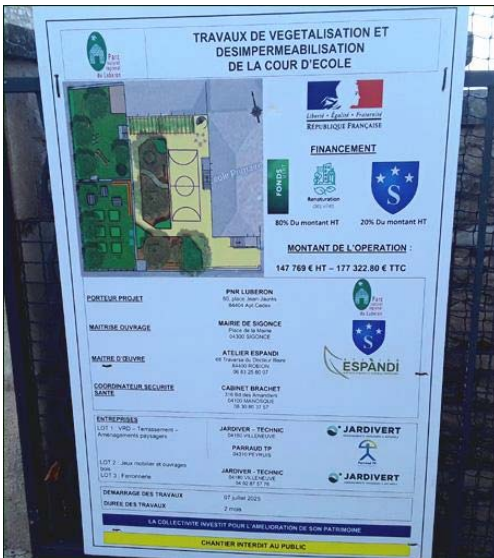
Les travaux dans la cour de l'école.