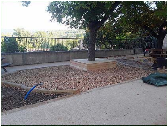
Une autre partie de cour bien agencée.